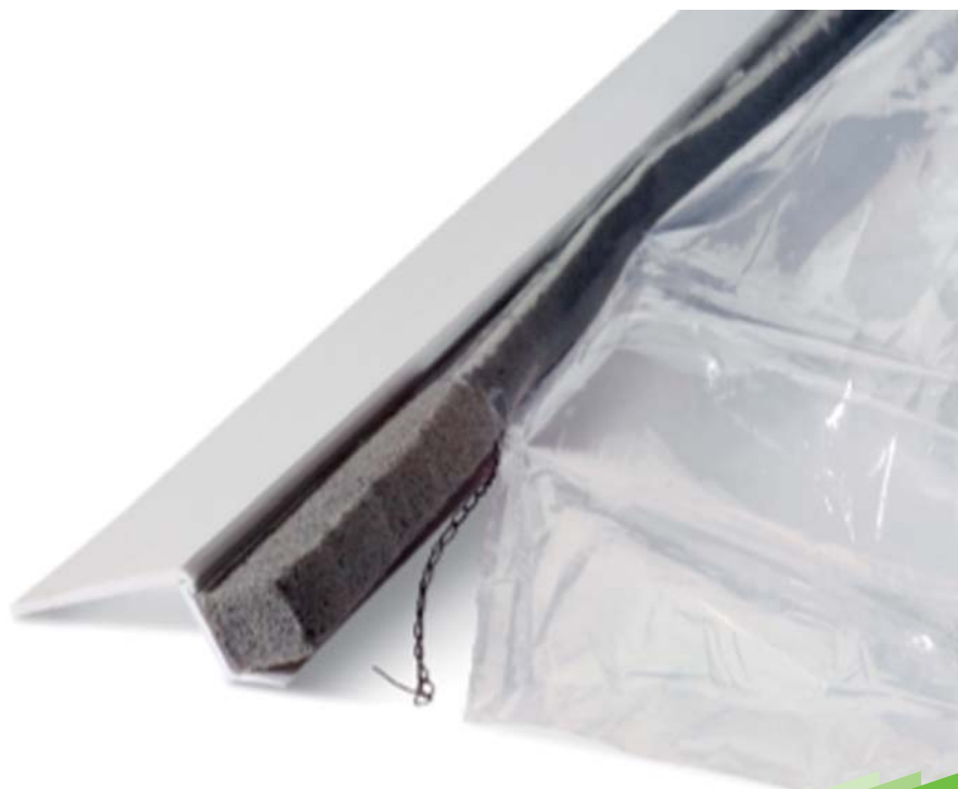
Okenní lišta exteriér