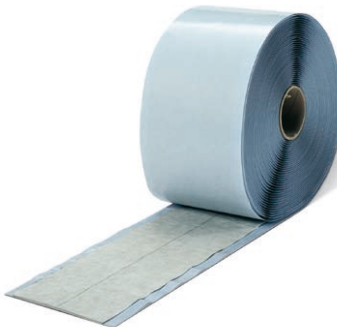
illbruck Butyl Fleece

Ďalšie rozmery na požiadanie Rozmerová tolerancia podľa DIN 7715 P 3