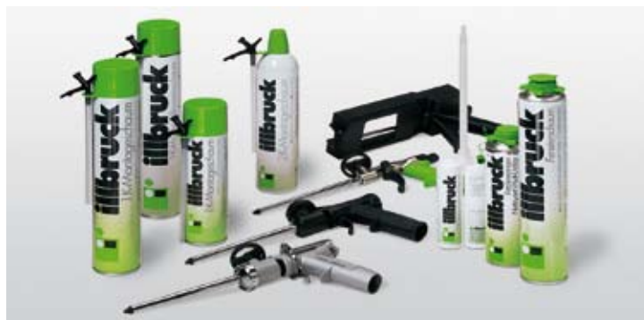
illbruck sortiment PU pien

preto zodpovednosť za ne nesiete vy. Nepreberáme zodpovednosť vyplývajúcu z tohto technického listu. Dodávky sa riadia výlučne našimi všeobecnými dodacími a platobnými podmienkami.